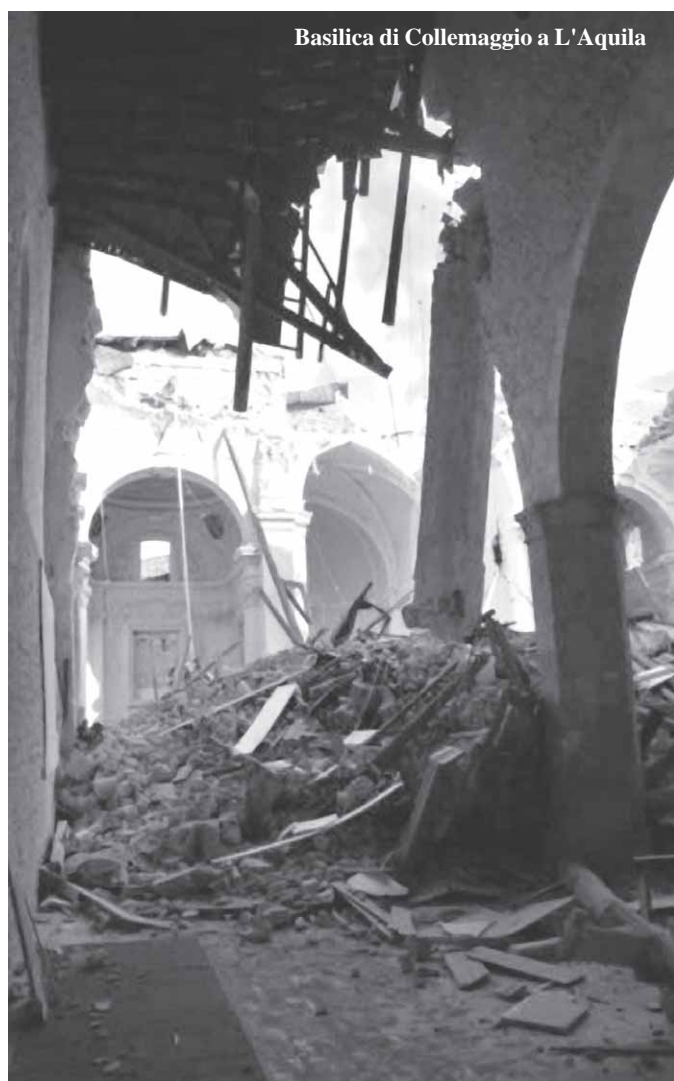
Basilica di Collemaggio a L'Aquila