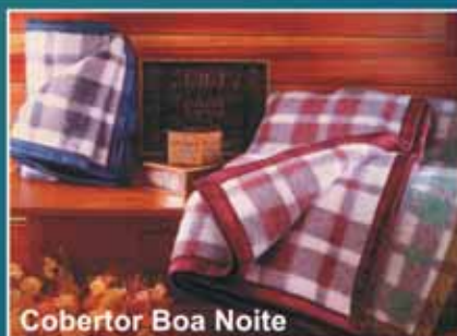
Cobertor Boa Noite