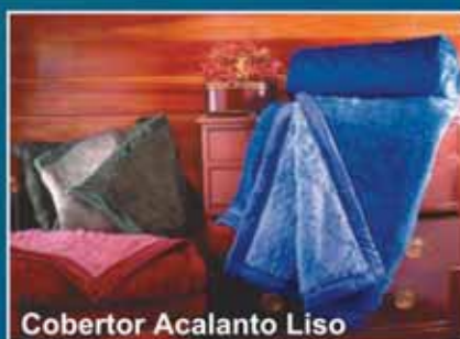
Cobertor Acalanto Liso