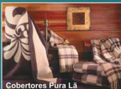
Cobertores Pura Lã