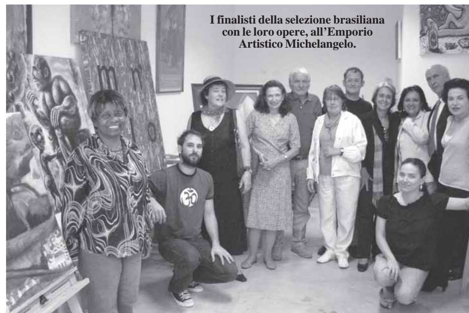
I finalisti della selezione brasiliana con le loro opere, all'Emporio Artistico Michelangelo.