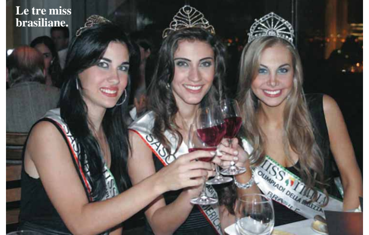
Le tre miss brasiliane.

Per avere la più grande colonia italiana all'estero il Brasile è l'unico paese che ha concorso così con tre candidate alla finalissima a Venezia, spettacolo che è stato trasmesso al mondo intero attraverso la RaiItalia. (v.nardini)