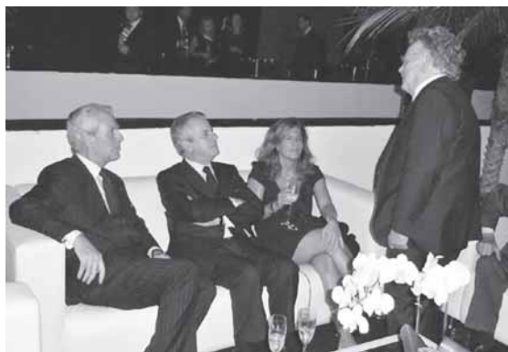
Tronchetti Provera, Claudio Scajola, Emma Marcegaglia e Steno Marcegaglia