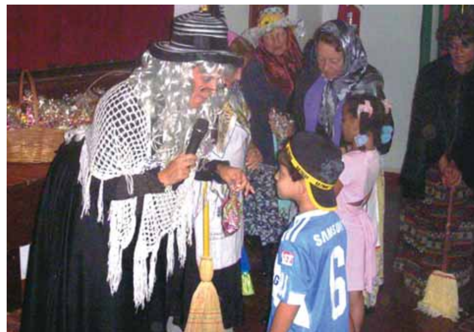
La Befana ed i bambini di Sousas in un momento della Festa della Befana.