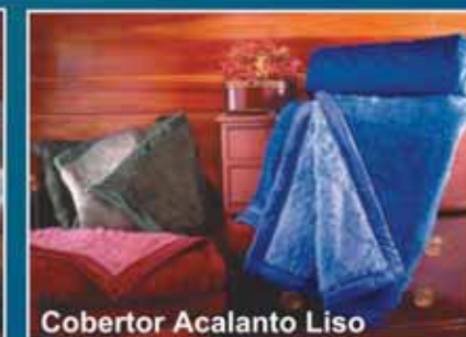
Cobertor Acalanto Liso