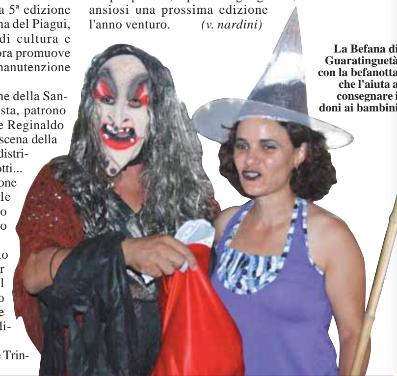
La Befana di Guaratinguetá con la befanotta che l'aiuta a consegnare i doni ai bambini

Un ringraziamento particolare, oltre al Padre Trin-