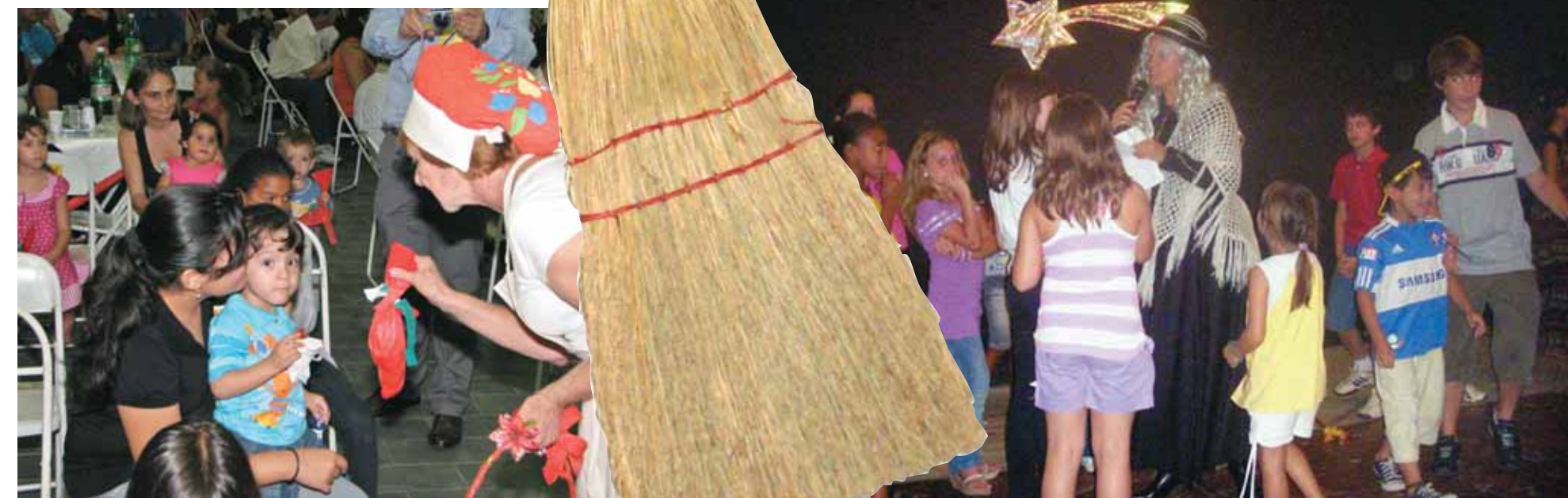
La Befana consegna dolciumi ai bambini di Salto - SP

La Festa è continuata nel Salone delle Feste della Associazione, con la presenza del Vice Console d'Italia in San Paolo, Marco Leone, oltre ai Consiglieri del Comites, con una grandiosa confraternizzazione festiva, che si è conclusa con l'arrivo della Befana con doni, dolciumi, biscotti e panettoni (donati dalla Bauducco) per i bambini, mentre per gli adulti era stato preparato un rinfresco con bibite e vino.