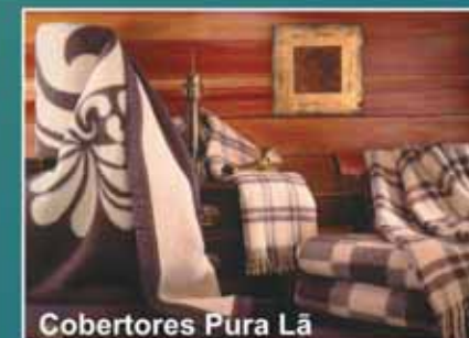
Cobertores Pura Lã

Viene viene la Befana, vien dai monti a notte fonda. Come è stanca! La circonda neve, gelo e tramontana. (da Wikipedia.it)