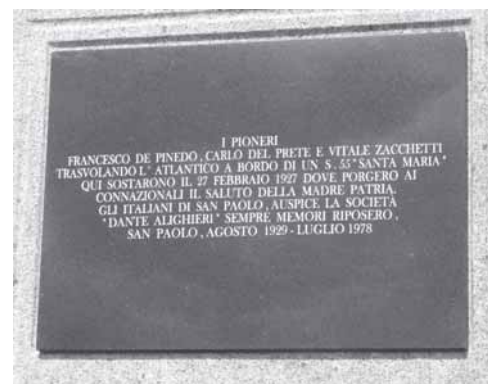
La nuova lapide che sostituisce quella di bronzo del 1978.