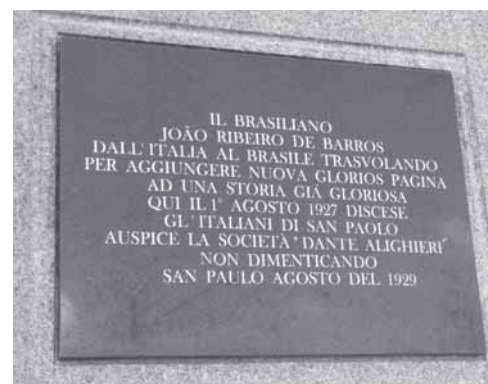
La lapide che sostituisce l'originale del 1929.