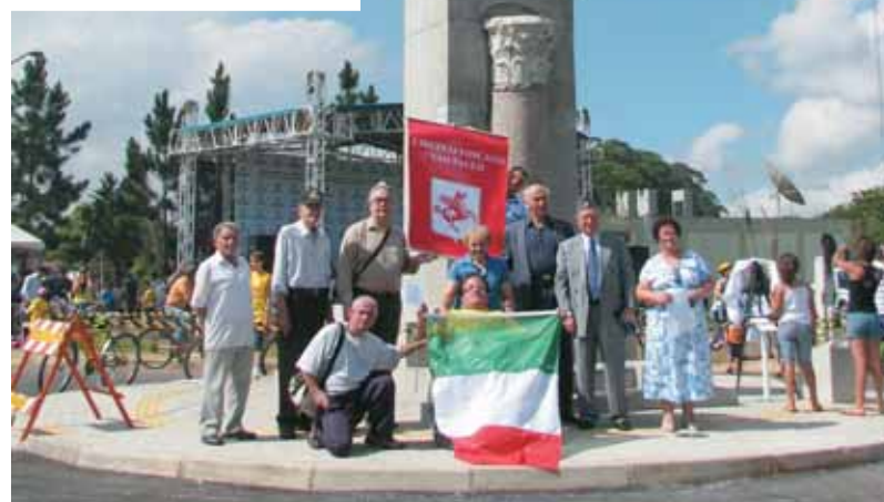
Il Circolo Toscano presente alla inaugurazione.