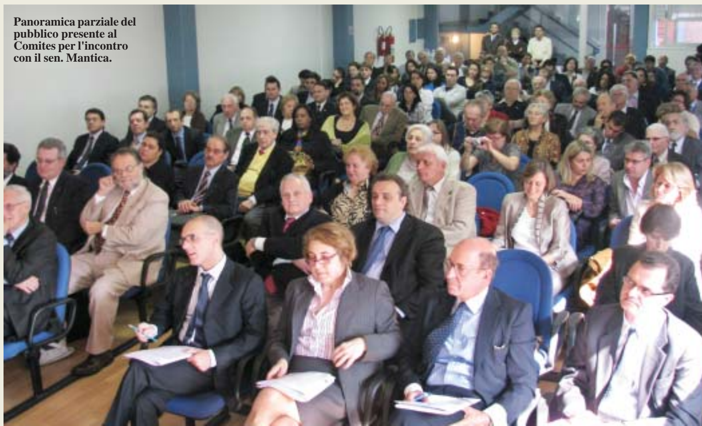
Panoramica parziale del pubblico presente al Comites per l’incontro con il sen. Mantica.