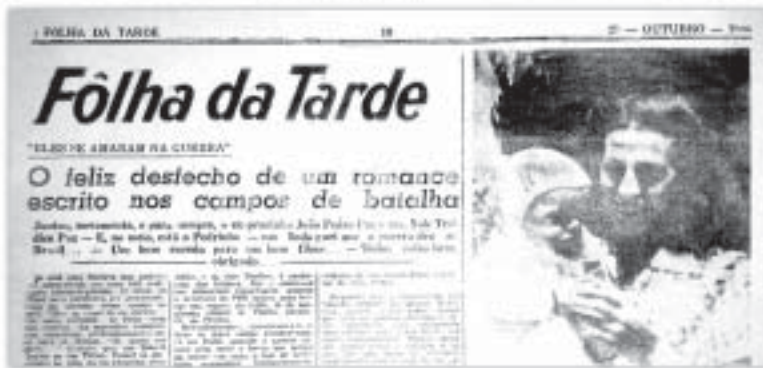
La Folha da Tarde, di Porto Alegre, notizia la vicenda.