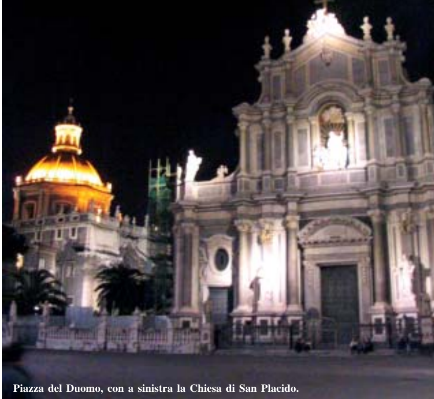
Piazza del Duomo, con a sinistra la Chiesa di San Placido.