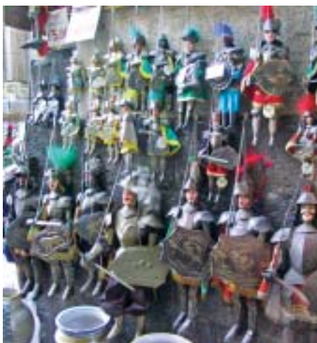
I caratteristici pupi.