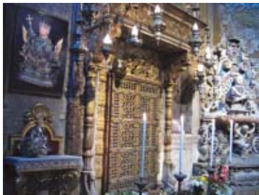
La Cappella di Sant'Agata, a destra dell'altare maggiore del Duomo.