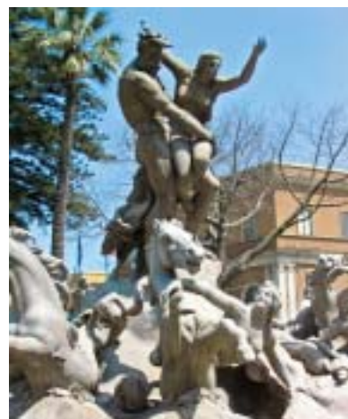
Fontana del Ratto di Proserpina, in Piazza Giovanni XXIII.