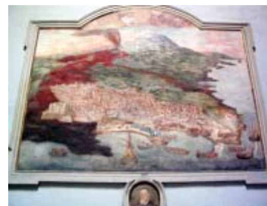
Catania e l'eruzione dell'Etna del 1669.

bellezza di una terra fertile, bagnata un tempo dal fiume Amenano; la sua felice posizione geografica; il calore delle sue genti. E ognuno di loro, attingendo ricchezze di ogni tipo, ha lasciato indelebili tracce del proprio passaggio, attraverso uno scambio continuo e fruttuoso che ci ha tramandato la città attuale, in tutto il suo splendore.