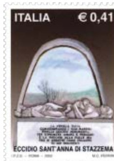
Monumento per l'eccidio di Sant'Anna di Stazemma.

L'opera si alterna sugli avvenimenti nei due versanti d'azione: il pistoiese, con Pescia, Stignano, Vellano, Macchino, Prunetta, Le Piastre, Pontepetri, Avaglio, Buggiano, Massa Cozzile, San Marcello Pistoiese, Porretta Terme, Casalecchio di Reno, Sasso Marconi; e quello lucchese, con Porcari, Strettoia, Seravezza, Sant'Anna di Stazemma e tanti altri nella Garfagnana. Una lettura interessante e scorrevole da farsi tutta d'un fiato. (vezio nardini / rivista oriundi)