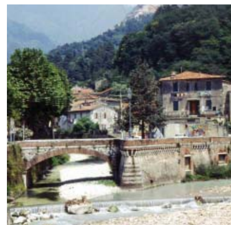
Seravezza, bagnata dal fiume Versilia.