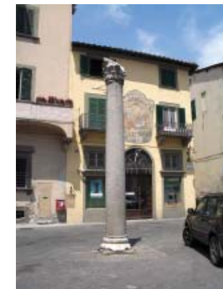
Piazza Colonna Mozza a Lucca.