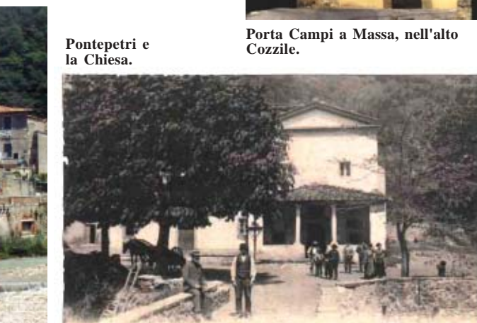
Pontepetri e la Chiesa.