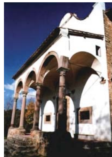
Croci - Santuario Beata Vergine del Carmelo.