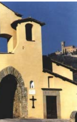
Porta Campi a Massa, nell'alto Cozzile.