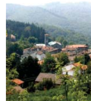
Una veduta di Prunetta.

Il Circolo Toscano e l'Istituto Culturale Toscano, invitano la S.V. alla presentazione della nuova pubblicazione del