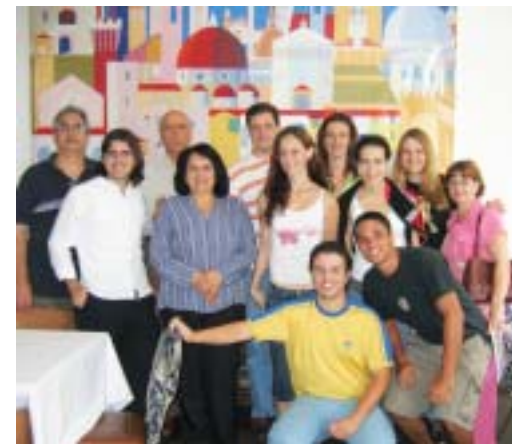
Na foto, o grupo de oito bolsistas do Circolo Toscano e do Circolo Italiano di Toscana di Riacho Grande, na reunião de "dicas e barbas" que aconteceu no Circolo Italiano de S. Paulo, em dezembro último, antes da viagem deles em janeiro. Dispensável dizer que o grupo voltou ma-ra-vi-lhoso por tudo o que viveram naquelas 4 semanas.

As inscrições para o curso de julho 2007 se encerram em abril. Por isso os interessados devem se informar sobre a documentação necessária (basicamente idade de 18 a 30 anos, comprovação de origem toscana e algum conhecimento da língua italiana) junto ao Circolo Toscano o mais rapidamente possível.