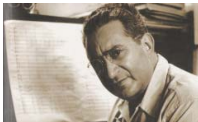
il Maestro Camargo Guarnieri.