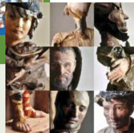
Ex voto

Lungo le rive del Mincio, a pochi chilometri da Mantova, sorge nel piccolo paese di Montanara , nel comune di Curtatone , il Santuario di Santa Maria delle Grazie , costruita tra il 1399 e il 1406 per ordine di Francesco I Gonzaga.