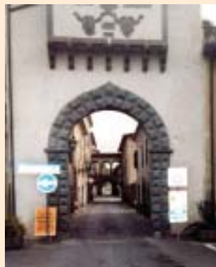
Lunigiana La porta nord di Filetto

Poco più avanti la Chiesa di Bardone che sventa da quindici secoli sul crinale fra la vallata del Taro e i lembi ancora fitti di bosco dell'alta Val Baganza . In questo tratto la via Francigena è scandita da segnavia in forma di pietre miliari, decorati con una formella in terracotta raffigurante un pellegrino, che raddoppiano la tradizionale segnaletica escursionistica”.