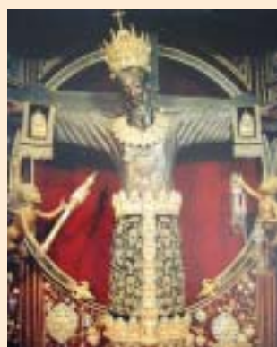
Volto Santo a Lucca