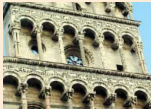
Chiesa di San Michele a Lucca

Seguiamo il racconto di Brizzi verso il Golfo dei Poeti . “Dopo l'appennino parmense, si entra in Lunigiana , terra di mezzo, fantastica, mi ha colpito per la sua natura di crocevia, come dialetto, come architettura. Pontremoli è il capoluogo onorario-, mi ricorda la tipologia di