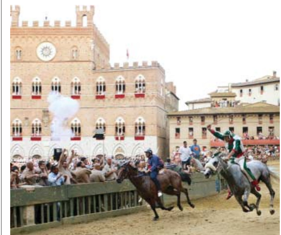
L'arrivo del Palio: vince l'Oca (sulla destra)

(02 luglio 2007)