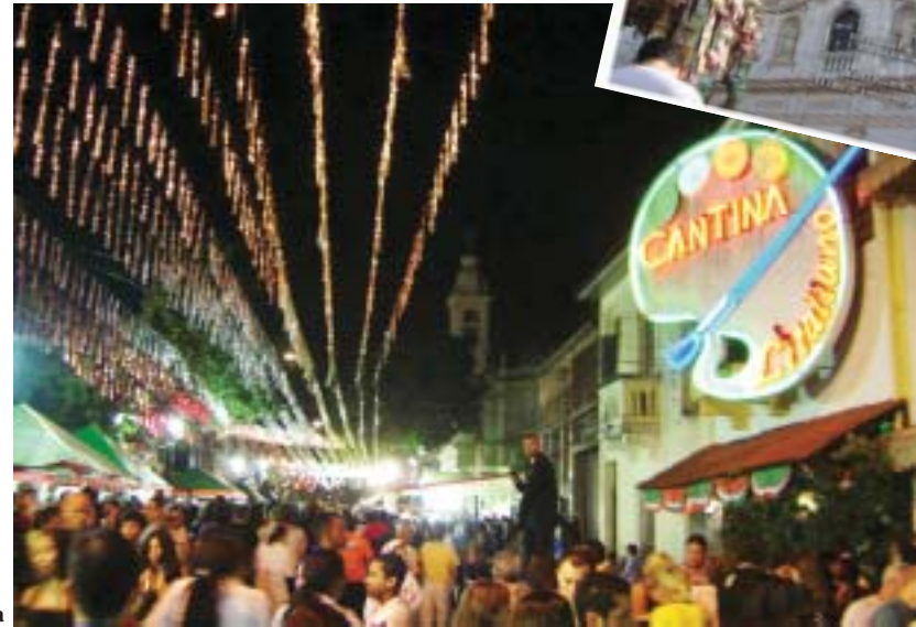
A Rua 13 de Maio na noite da abertura da Festa

A arrecadação da Festa destina-se à manutenção das obras assistenciais da Paróquia.