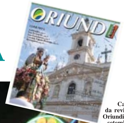
Capa da revista Oriundi de setembro 2006, com imagem da Procissão em 2006.